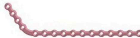
Placa de Reconstrucción