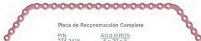
Placa de Reconstrucción Completa